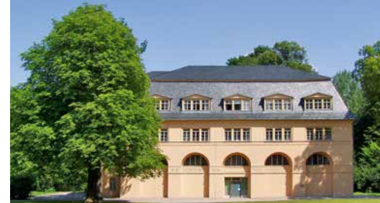
Reithaus im Park an der Ilm