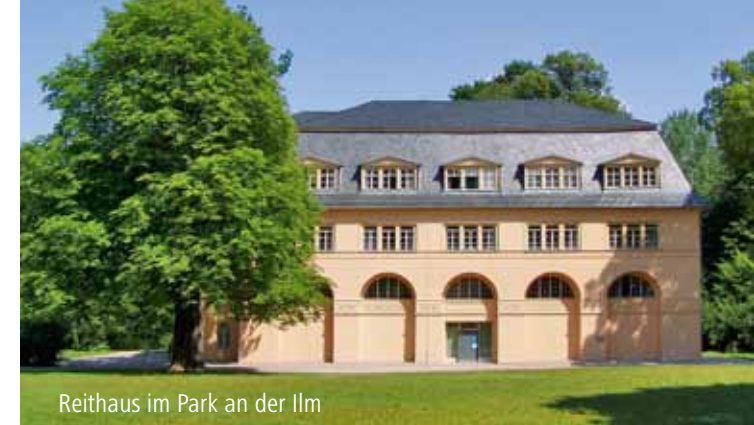
Reithaus im Park an der Ilm